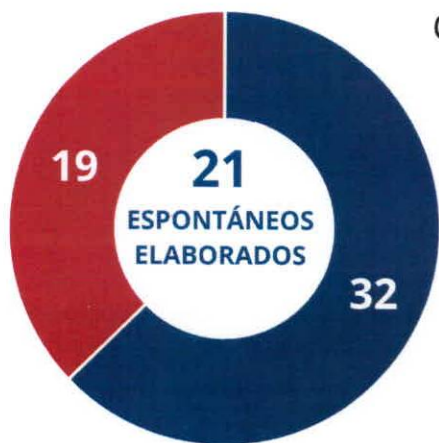
CANTIDAD DE PERSONAS DENTRO DE INFORMES