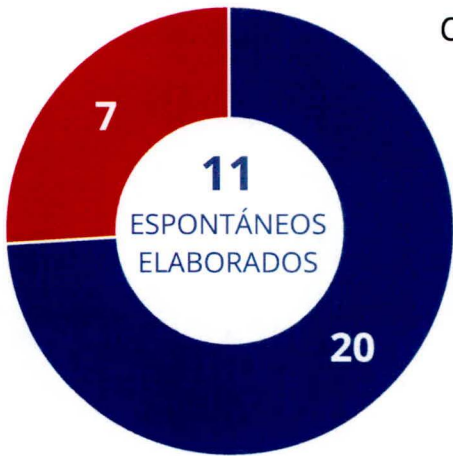
CANTIDAD DE PERSONAS DENTRO DE INFORMES